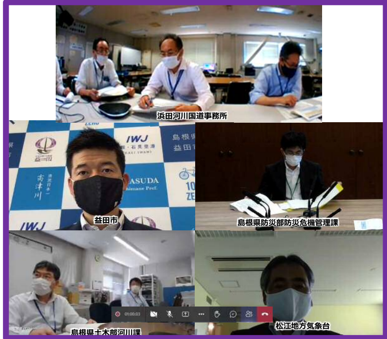
Web会議による高津川水系大規模氾濫時の減災対策協議会