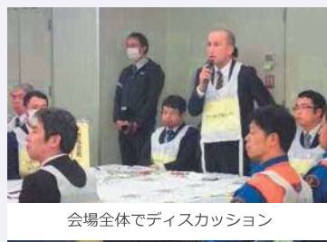
会場全体でディスカッション