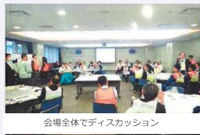
会場全体でディスカッション