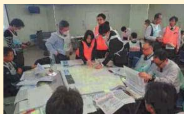
復旧活動における行動項目を整理