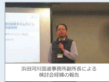
浜田河川国道事務所副所長による 検討会経緯の報告