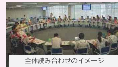
全体読み合わせのイメージ