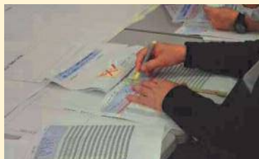
自機関の行動項目を確認の様子