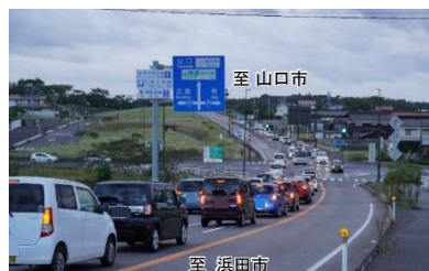
高津IC交差点の渋滞状況