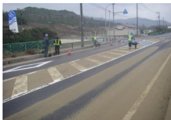
持石海岸からの飛砂・堆砂