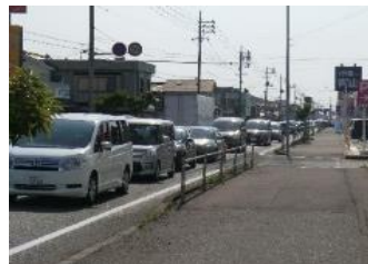
高津IC付近の渋滞状況