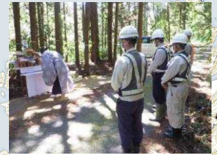
5月8日江津市黒松地内で、安全祈願祭を行いました。

※表示している計画ルートは、概ねの位置を示したものです。 ※この地図は、国土地理院長の承認を得て、国土地理院発行の2万5千分1地形図を複製したものです。 (承認番号 令元情複、第329号)