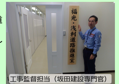
工事監督担当 (坂田建設専門官)

4月1日より、江津市人権啓発センター内に「福光・浅利道路推進室」を開設しました。地域の皆様との交流の場として、また、工事を進めるための拠点として活用していきます。