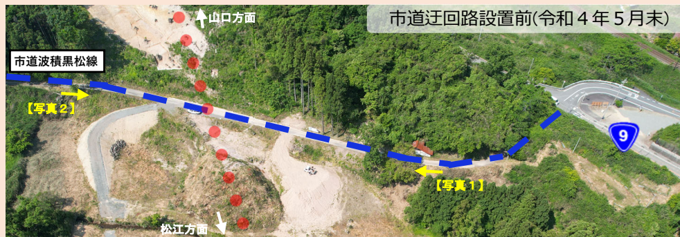
市道迂回路設置前(令和4年5月末)

福光・浅利道路事業に伴う埋蔵文化財(高丸遺跡)の発掘調査のため、市道波積黒松線の迂回路を設置しました。付近を通行される際は十分御注意ください。