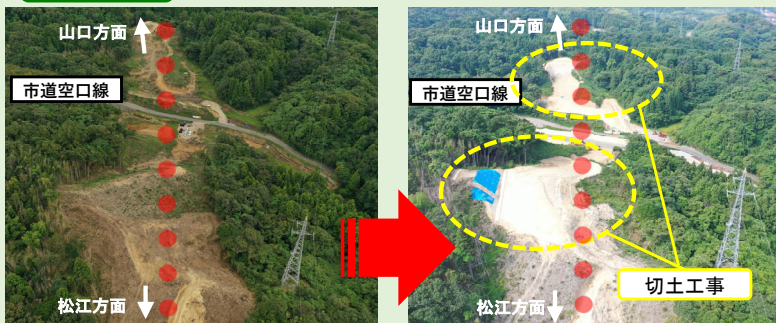
工事進捗状況(令和3年9月末)