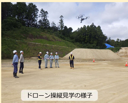
ドローン操縦見学の様子