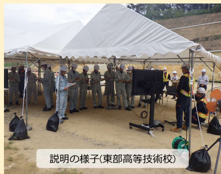
説明の様子(東部高等技術校)