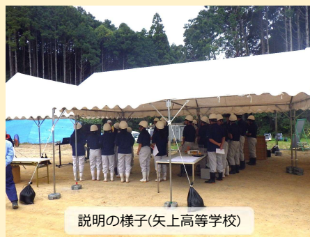
説明の様子(矢上高等学校)