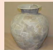
須恵器(同タイプの復元品)

奈良時代の須恵器(登り窯で焼成されたうわぐすりをしない固い焼き締め陶器)が発見されました。これは、甕(かめ)の破片と推定されています。