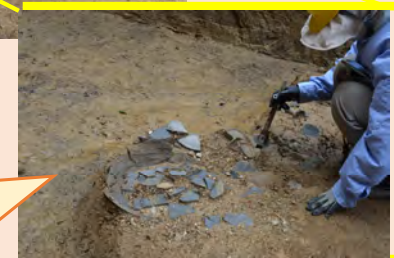
調査箇所拡大写真(令和3年8月)

奈良時代の須恵器(登り窯で焼成されたうわぐすりをしない固い焼き締め陶器)が発見されました。これは、甕(かめ)の破片と推定されています。