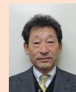
【小石川管理技術者】