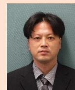
【花田調査設計課長】