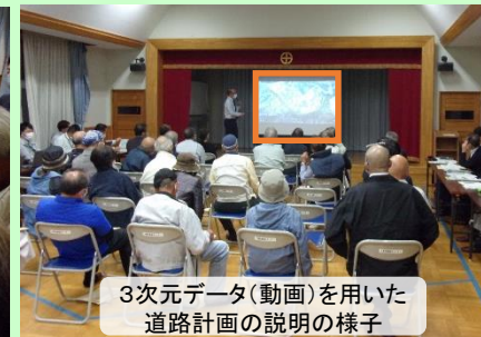
3次元データ(動画)を用いた道路計画の説明の様子