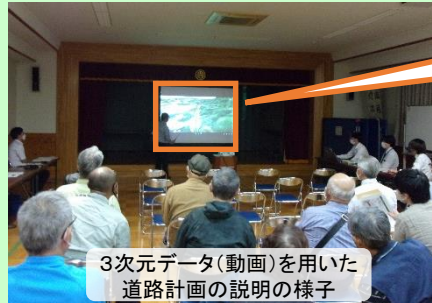
3次元データ(動画)を用いた道路計画の説明の様子