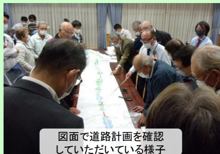
図面で道路計画を確認していただいている様子