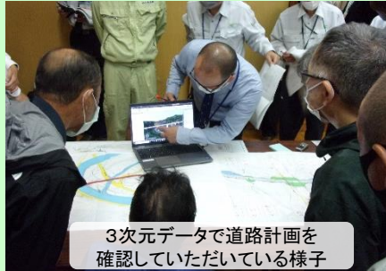
3次元データで道路計画を確認していただいている様子