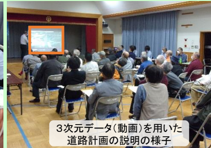
3次元データ(動画)を用いた道路計画の説明の様子