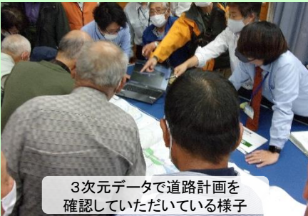
3次元データで道路計画を確認していただいている様子