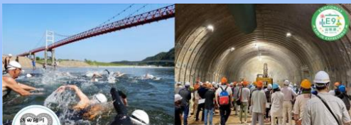
浜田河川国道事務所