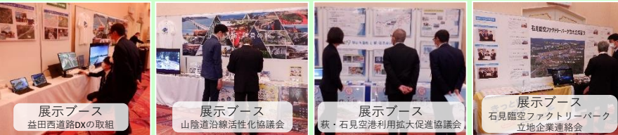
展示ブース 益田西道路DXの取組