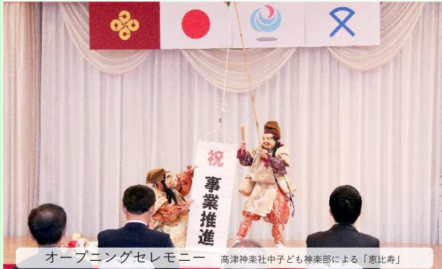
オープニングセレモニー 高津神社中子ども神楽部による「恵比寿」