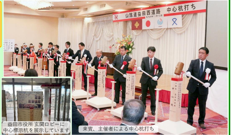
益田市役所玄関ロビーに中心標示杭を展示しています