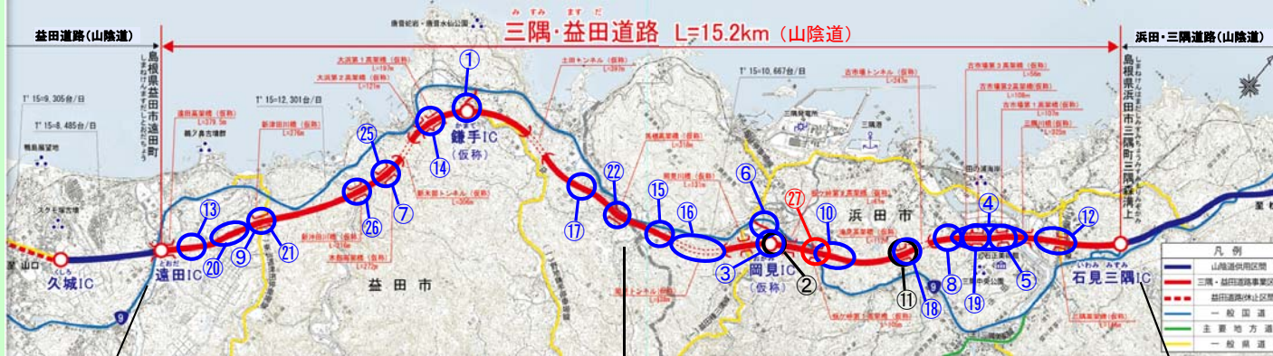
※この地図は、国土地理院長の承認を得て、国土地理院発行の2万5千分1地形図を複製したものである。(承認番号 令元情標 第328号)