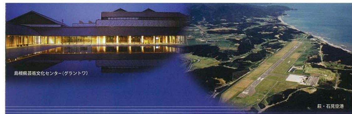
島根県芸術文化センター(グラントワ)