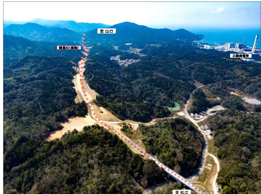
④岡見地区より、山口方面(岡見IC)を望む