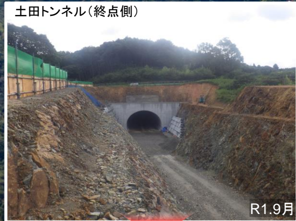
土田トンネル(終点側)