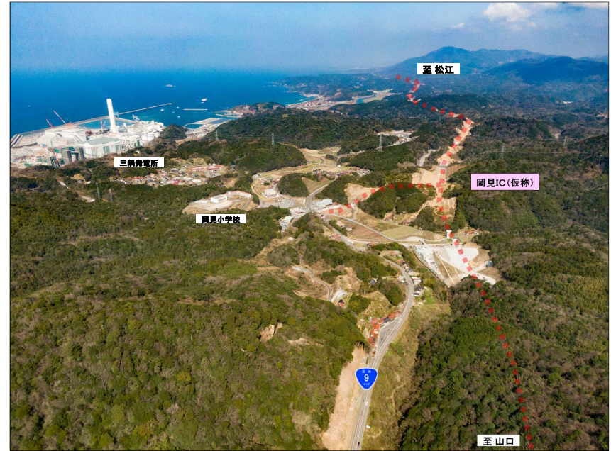
⑥岡見地区より、松江方面(岡見IC)を望む