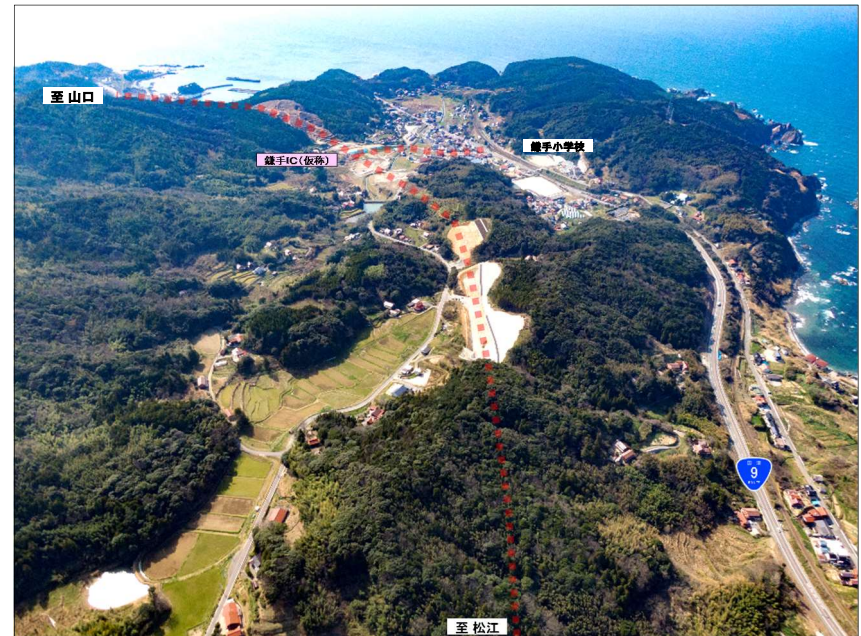
⑧鎌手地区より、山口方面(鎌手IC)を望む