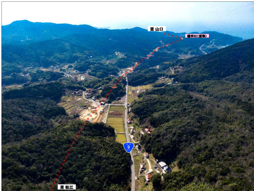
⑦土田地区より、山口方面を望む