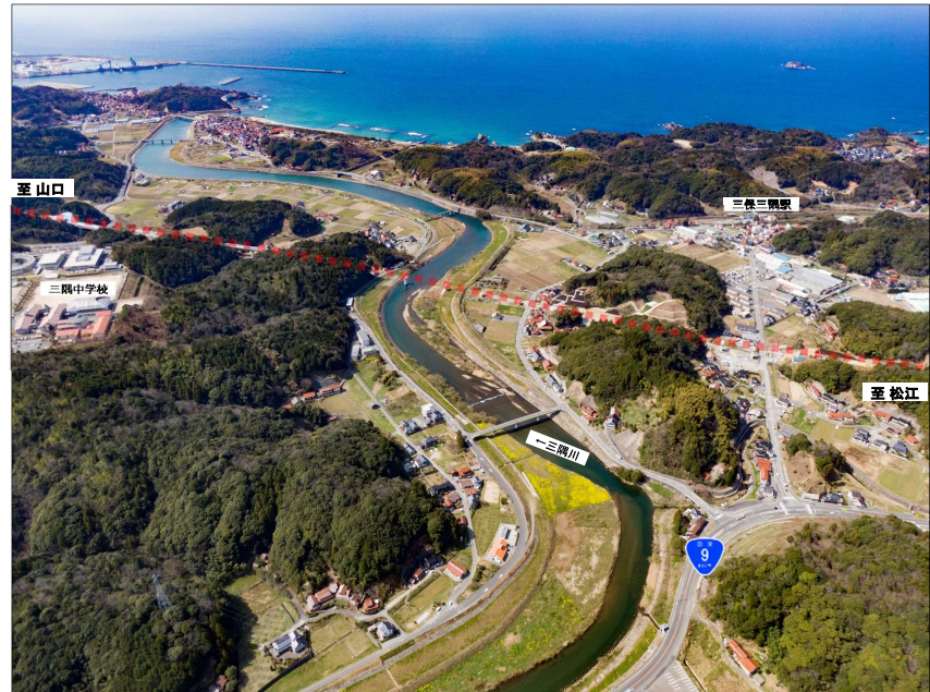
②三隅地区より、日本海を望む