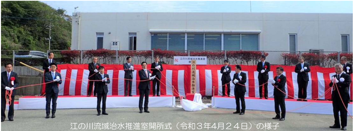
江の川流域治水推進室開所式（令和3年4月24日）の様子