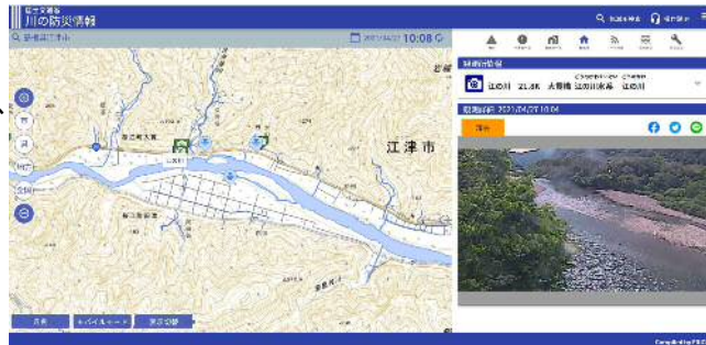
現在の水位やカメラ映像を確認することができます