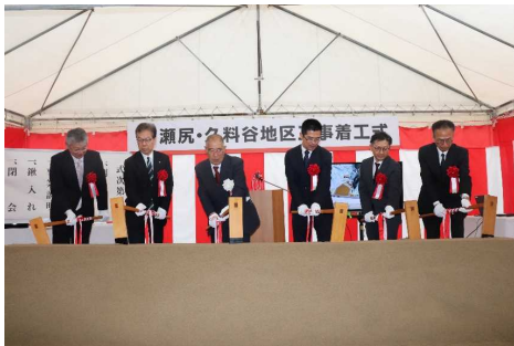
【事業関係者による緞入れ】

ARは拡張現実とも言われ、下の写真のように堤防等のイメージを現地の実際の風景に合わせて立体的に見せることができる技術です。