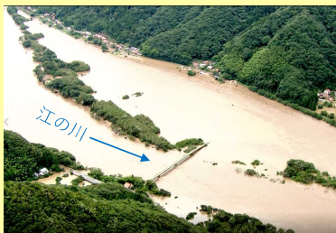
【令和2年7月豪雨時の浸水状況】