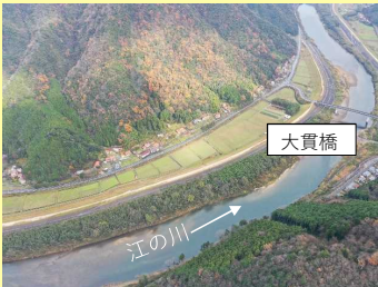
【田津地区航空写真】