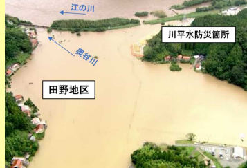
【令和2年7月豪雨時の浸水状況】