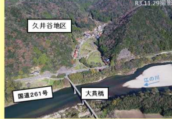
【上大貫地区・下大貫地区航空写真】