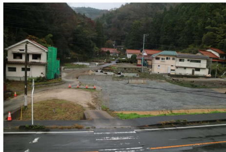
【瀬尻・久料谷地区の風景】