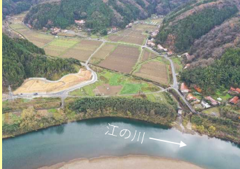
【田野地区航空写真】