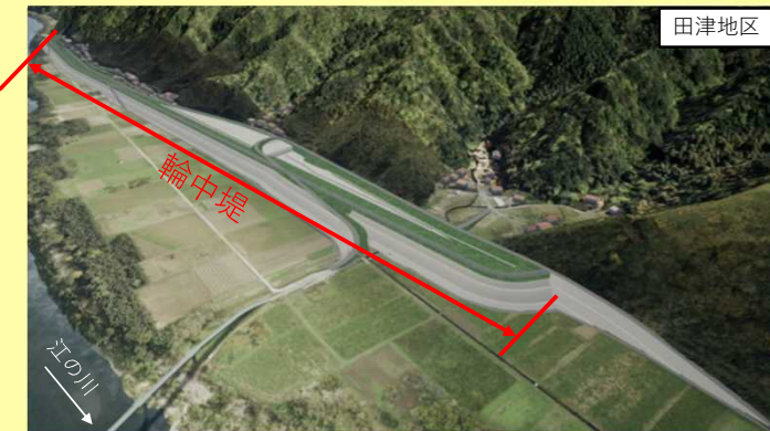
下流から見たイメージ