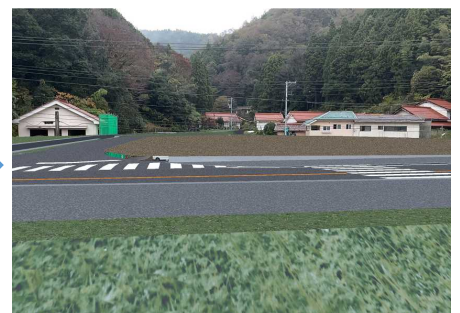
【ARによる完成イメージ】