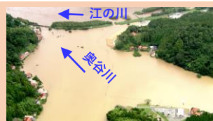
令和2年7月洪水時 田野地区浸水状況 江の川の氾濫により近年3度の浸水被害を受ける