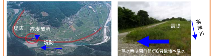
霞堤背後地の土地利用規制