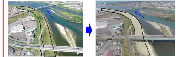
河床掘削事例（高津地区）