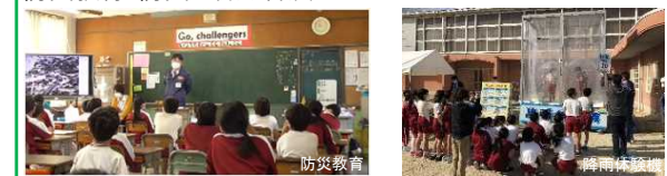
防災教育・防災知識の普及