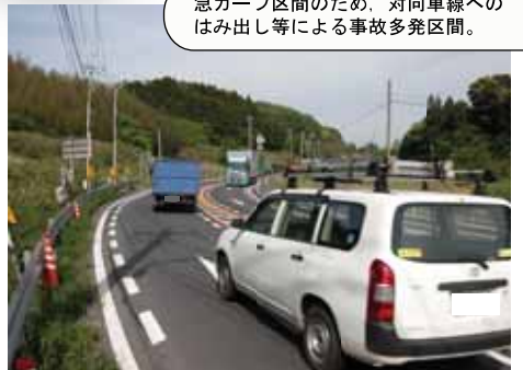
⑮ 国道9号 大田市朝山町朝倉：線形改良工事中