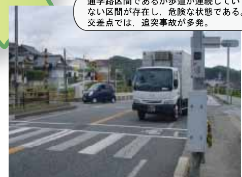
②4 国道9号 浜田市国分町：交差点改良、歩道拡幅工事中