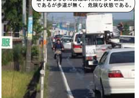
⑤ 国道9号 松江市東出雲町揖屋～出雲郷：歩道拡幅、交差点改良測量設計中