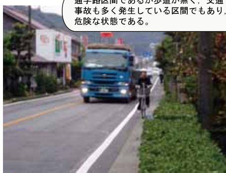
③8 国道9号 益田市横田町：歩道設置工事中