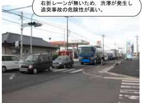
⑪ 国道9号 斐川町荏原中央西：交差点改良工事中