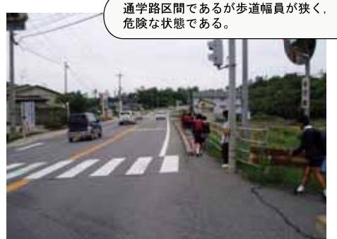
②3 国道9号 浜田市久代町：歩道設置工事中