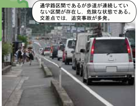
④ 国道9号 松江市東出雲町揖屋五反田：交差点改良測量設計中