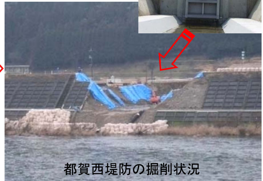
都賀西堤防の掘削状況