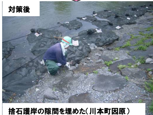
捨石護岸の隙間を埋めた(川本町因原)

※なお本写真につきましては、修繕等の対応をした中から代表的なものを掲載しています。