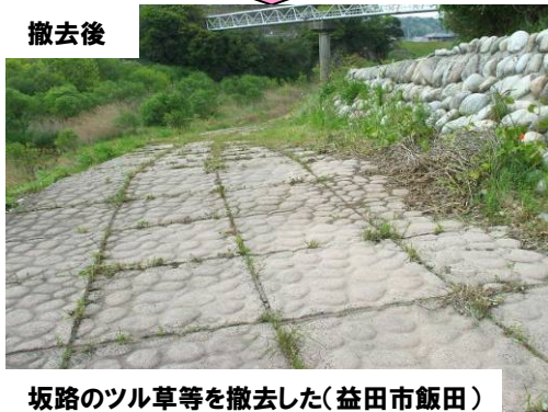
坂路のツル草等を撤去した(益田市飯田)