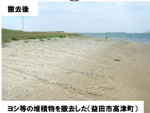
ヨシ等の堆積物を撤去した(益田市高津町)