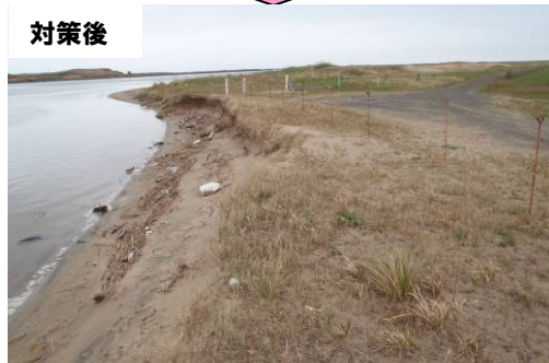
鉄柵が倒れないように再設置した(江津市渡津町)