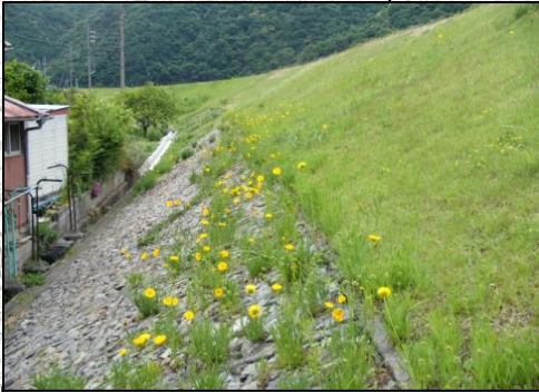
渡津町長田(江の川右岸2k900付近) 施工予定時期: 6/10~6/21