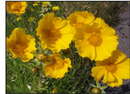
オオキンケイギクの花びら