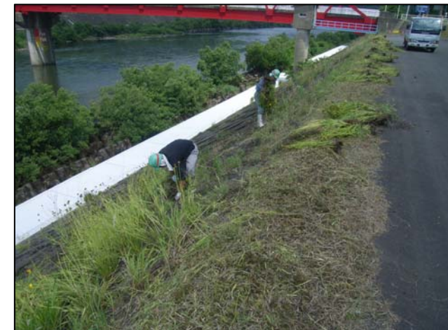
手抜きによる除去状況 (川本出張所)