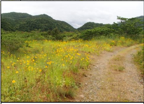
金田町千金(江の川左岸4k800付近) 施工予定時期: 6/10~6/21