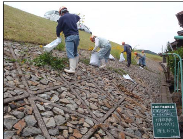
手抜きによる除去状況 (江の川下流出張所)