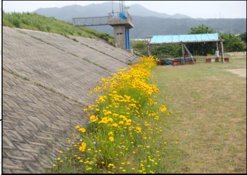
渡津町渡津(江の川右岸1k000付近) 施工予定時期: 6/10~6/21