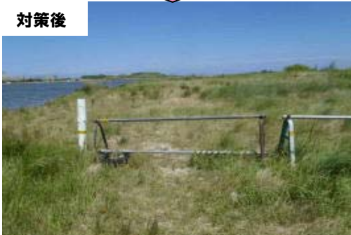
破損したバリケードを補修した(江津市渡津町)