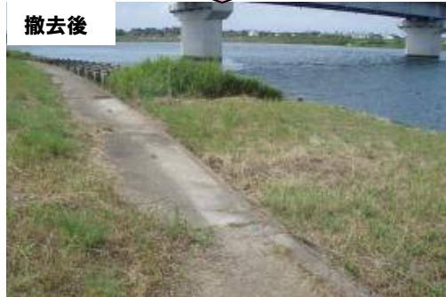
ヨシ等の堆積物を撤去した(益田市高津町)