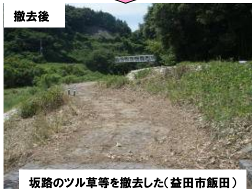
坂路のツル草等を撤去した(益田市飯田)

※なお本写真につきましては、修繕等の対応をした中から代表的なものを掲載しています。