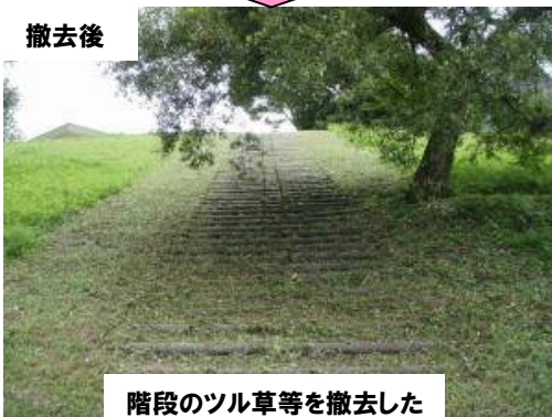
階段のツル草等を撤去した(美郷町亀村)カヌーの里