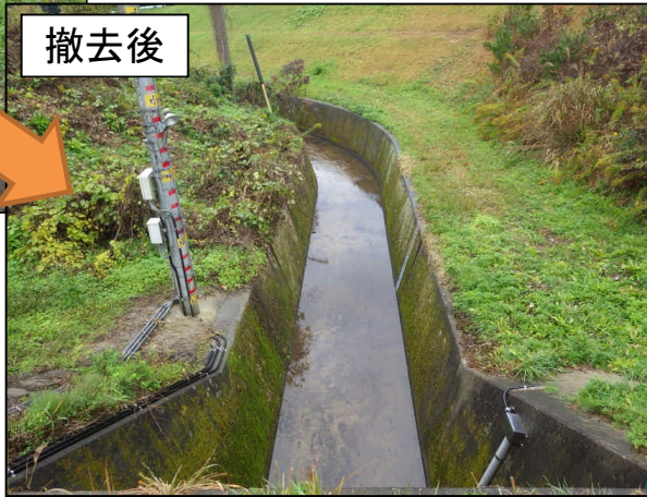
金地排水樋門 高津川本川(益田市虫追町)