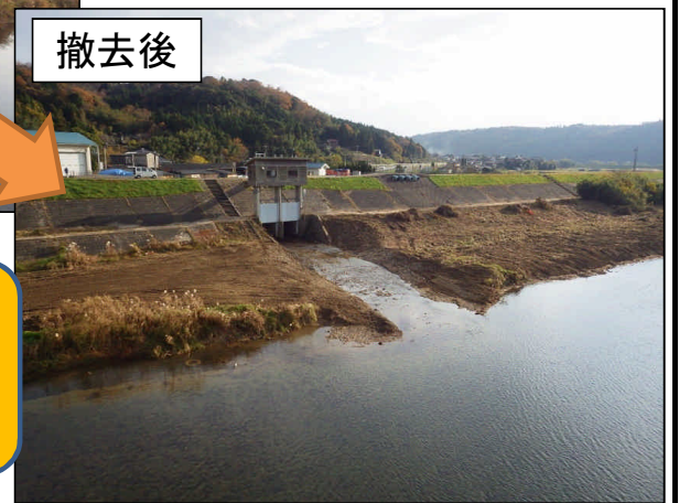
井谷川排水樋門 高津川本川(益田市神田町)