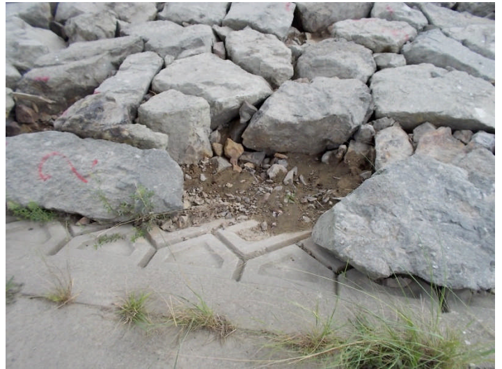
捨石の隙間（益田市高津町）