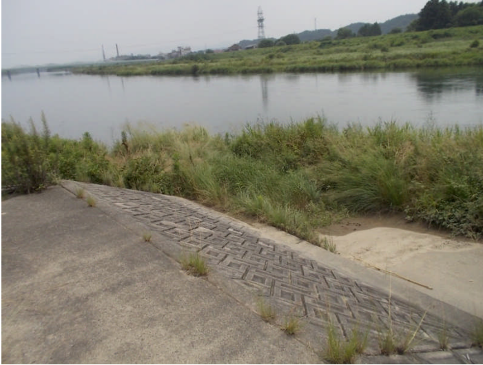
坂路の先が洗掘（益田市飯田町）