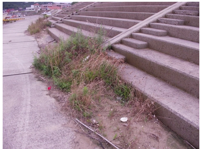
階段下に土砂が堆積し草が繁茂（江津市江津町）