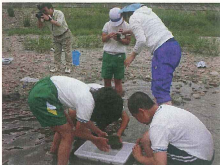
高津川の水生生物の採取