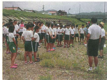
水生生物調査の説明