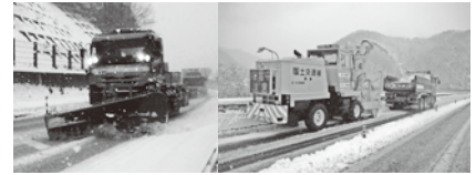
除雪の作業状況 運搬除雪の作業状況

道路を安全に通行いただくために、除雪や凍結防止剤の散布作業を行っています。また松江道においては路肩にたまった雪を取り除く「運搬除雪」を行うため、「通行止め」とする場合があります。ご不便をおかけしますが、ご協力をお願いします。