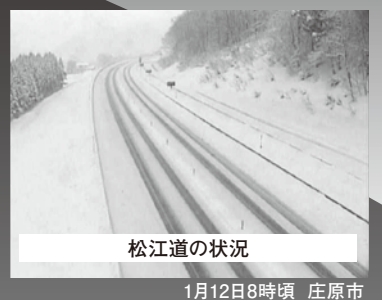
松江道の状況 1月12日8時頃 庄原市

松江道の最高地点は標高637m。中国地方の横断自動車道の中で最も高い所を通ります。峠を越えるドライブなど山間部の走行には、地形や標高の差による気温の低下や、降雪など、道路状況の変化に十分な注意が必要です。