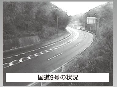
国道9号の状況 1月12日8時頃 大田市