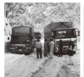
スリップ事故と立ち往生の状況

雪道では、冬用タイヤの未装着によるスリップ事故等による交通遮断が発生しています。雪道では、必ず冬用タイヤの装着と、燃料の確認、チェーンの携行をお願いします。