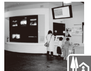
道の駅の情報コーナー

道の駅の「情報コーナー」では道路情報を提供していますので、お立ち寄りの際はぜひご確認ください。また、走行中には、温度表示板や道路情報板をご確認ください。