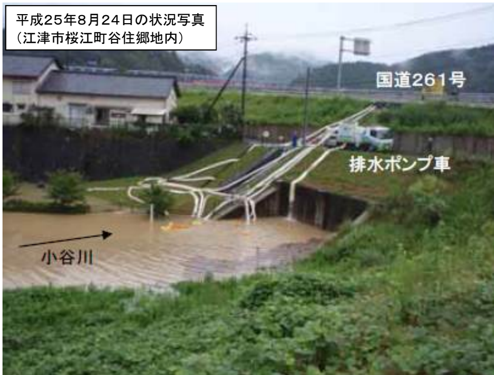
平成25年8月24日の状況写真 (江津市桜江町谷住郷地内)