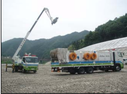
災害対策車訓練状況(邑智郡川本町川本地先)