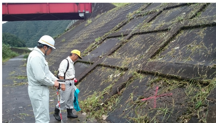
堤防点検の様子（川本町久座仁）