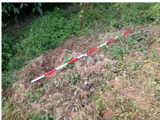
堤防の掘り起し（江津市江津本町）対応前