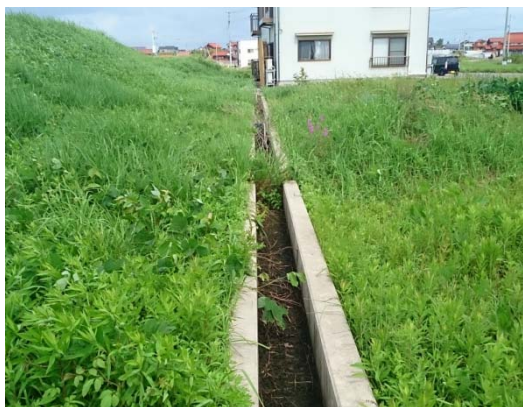
水路に土砂が堆積（益田市中島町）対応前