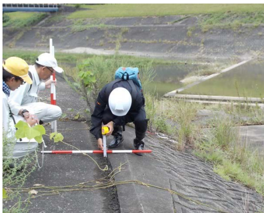
堤防点検の様子（益田市内田町）

高津川で107件、江の川で186件ありました。変状が確認された主な内容は、コンクリート構造物のひび割れ等高津川87件、江の川153件、その他(猪等の害獣による堤防の掘り起しや水路の土砂堆積等)高津川20件、江の川33件でした。猪等の害獣による堤防の掘り起しや水路の土砂堆積については、必要に応じて速やかに対応しました。なお、コンクリートのひび割れ等については、引き続き経過観察を行います。