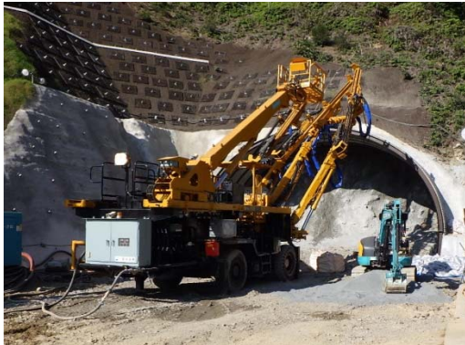
工事現場の状況(古市場トンネル工事)