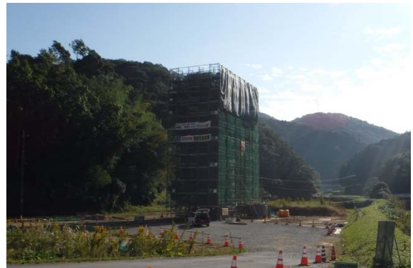
工事現場の状況(岡見川橋下部工事)