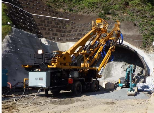
工事現場の状況(古市場トンネル工事)