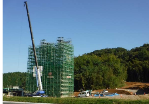
工事現場の状況(新津田川橋下部第2工事)