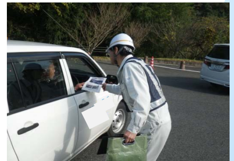
H28年度冬用タイヤの早期装着PRの広報状況 (道の駅シルクウェイにちはら 平成28年11月22日)