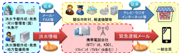
「洪水情報のプッシュ型配信」イメージ

ワイモバイル： http://www.ymobile.jp/service/urgent_mail/