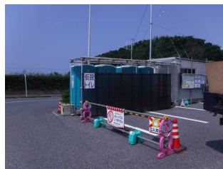
仮設トイレ設置状況

仮設トイレを4台設置しています。(24時間利用可能) 道の駅施設内のトイレもご利用可能ですが、営業時間内のご利用となりますのでご注意ください。 <営業時間> 9:00~17:30 (※毎週水曜日 9:00~17:00)