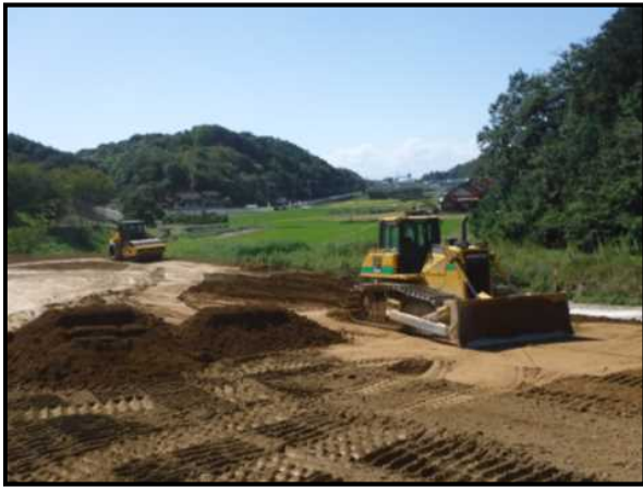
工事現場の状況（上古市地区改良外工事）