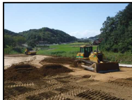
工事現場の状況 （上古市地区改良外工事）