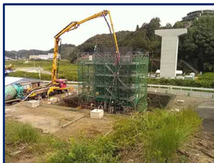
工事現場の状況 （岡見川橋下部第2工事）