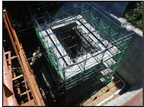
工事現場の状況（古市場第2高架橋第2工事）