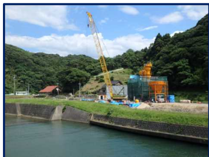
工事現場の状況 （新沖田川橋下部工事）