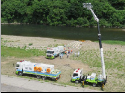
訓練状況(邑智郡川本町川本地先)