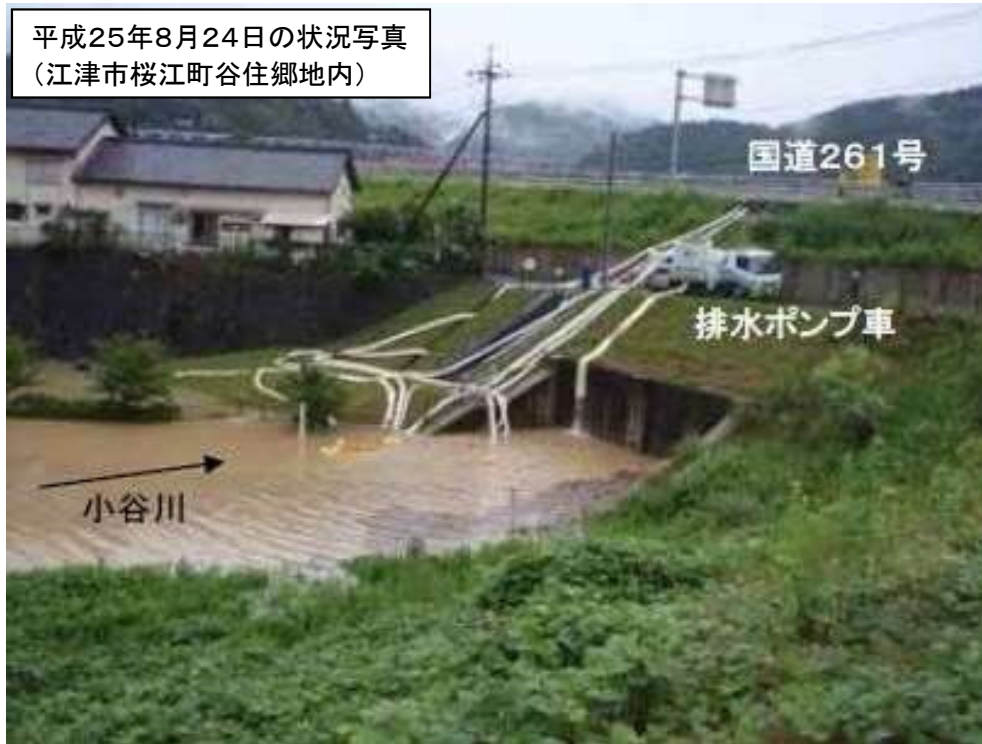
平成25年8月24日の状況写真 (江津市桜江町谷住郷地内)