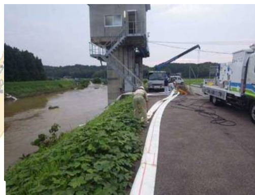
排水ポンプ車設置状況