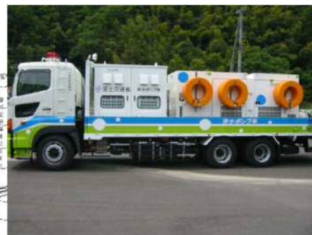
排水ポンプ車(30m 3 /分)