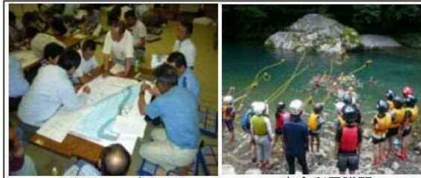
マイ防災マップづくり