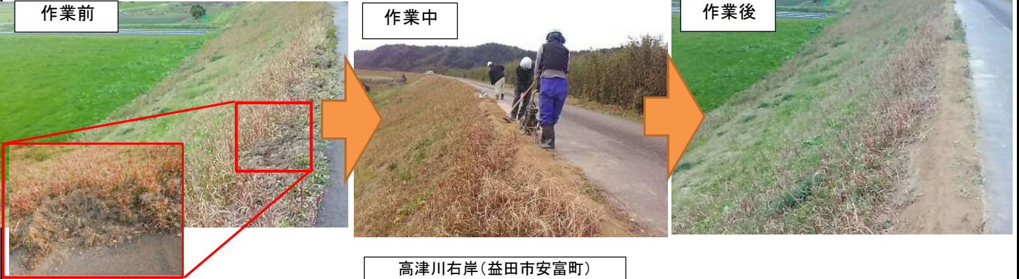
高津川右岸(益田市安富町)