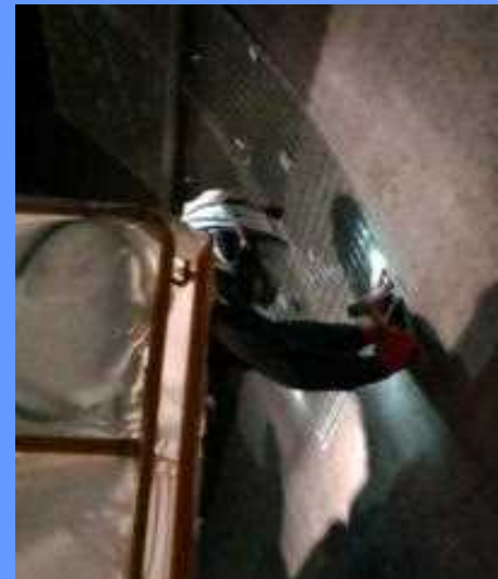
補修作業状況 (イメージ)

利用者の皆様には大変ご迷惑をおかけしますが、通行規制へのご理解とご協力をよろしくお願いします。