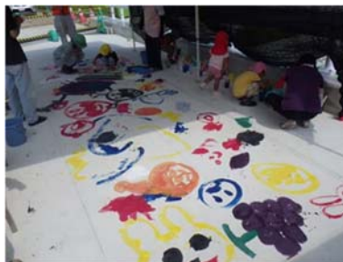
〈例：舗装前の橋面へのお絵かき〉

②古市場第2高架橋(仮称) 鉄筋結束体験(施工証明証授与) (2班に分かれて実施)