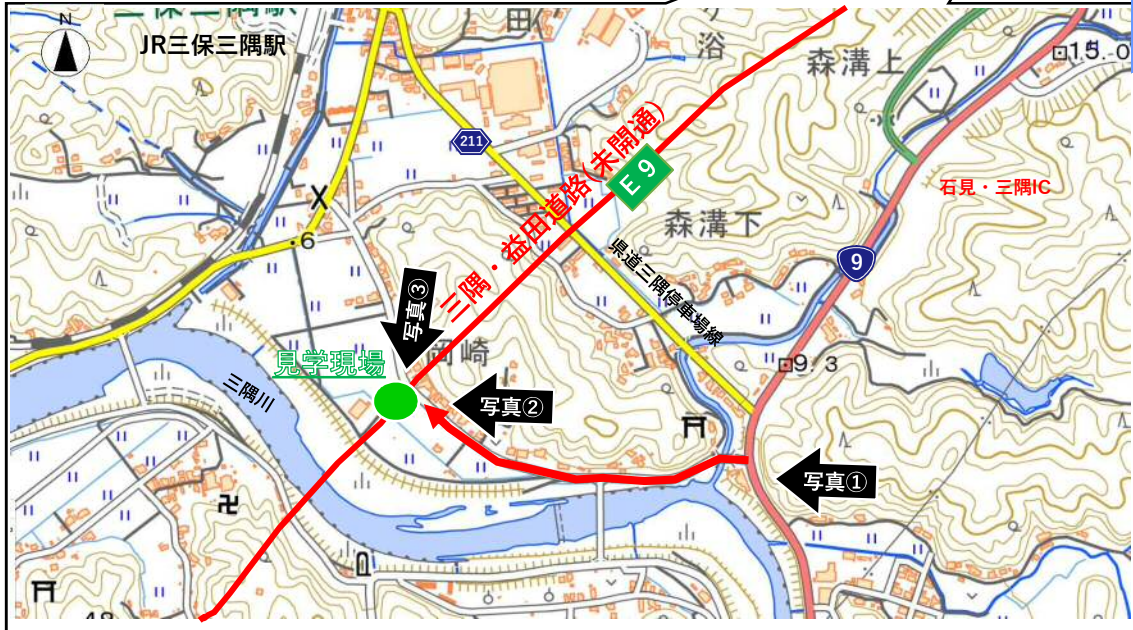
国道9号 → (県)岡崎線