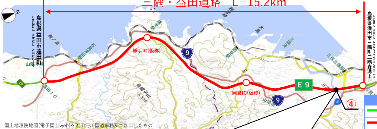
国土地理院地図(電子国土web)を浜田河川国道事務所で加工したもの