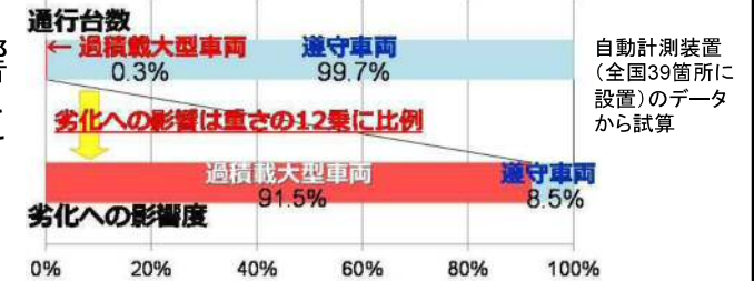
【図 道路橋の劣化に与える影響】

基準の2倍以上の重量超過の悪質違反者に厳罰化⇒現地取締りで違反を確認した場合は告発(レッドカード)