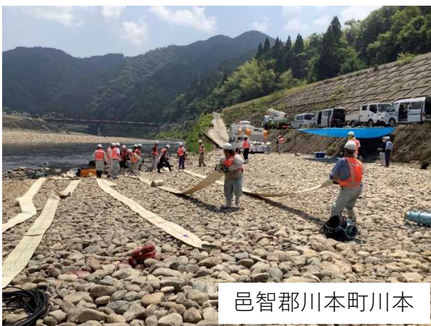
邑智郡川本町川本