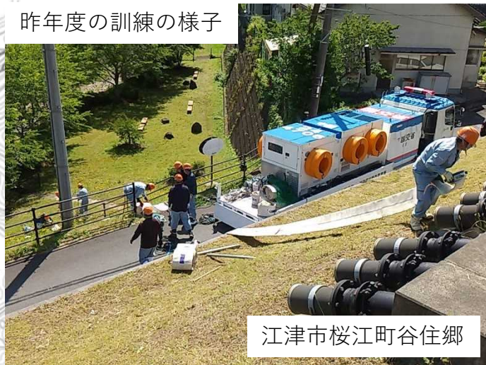
江津市桜江町谷住郷