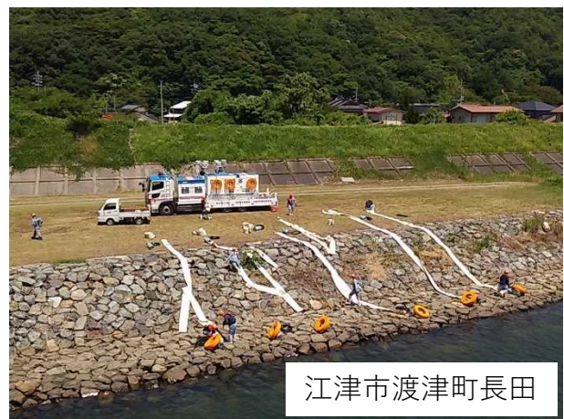
江津市渡津町長田