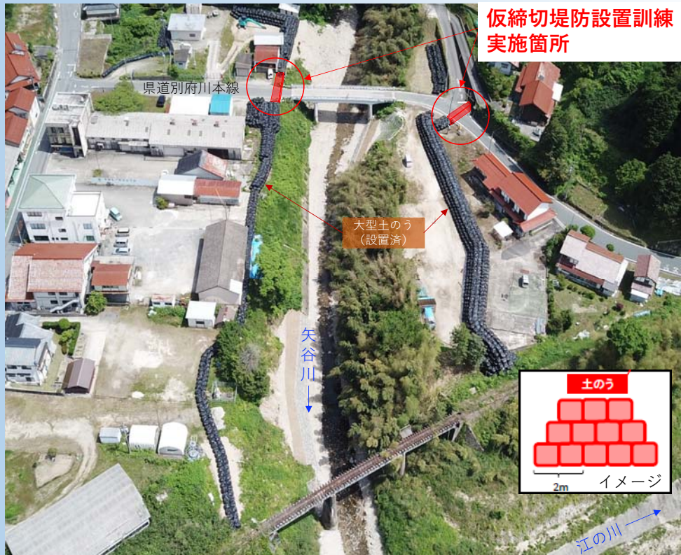
仮締切堤防設置訓練実施箇所