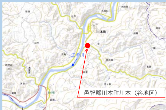
令和2年7月洪水状況

※仮締切堤防により、 ごうのかわ 江の川のバックウォーターに伴い発生した やだにがわ 矢谷川の氾濫による浸水被害を軽減します。