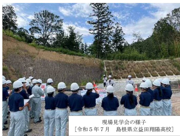
現場見学会の様子 [令和5年7月 島根県立益田翔陽高校]