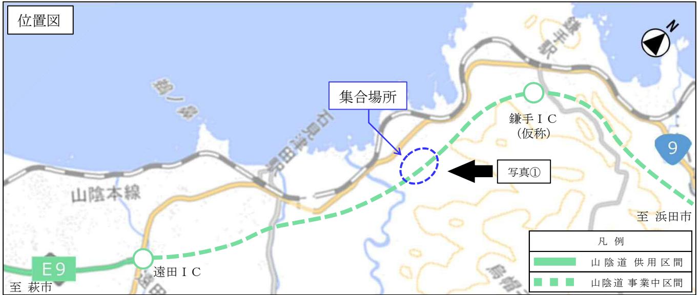
国土地理院地図(電子国土web)を浜田河川国道事務所で加工したもの