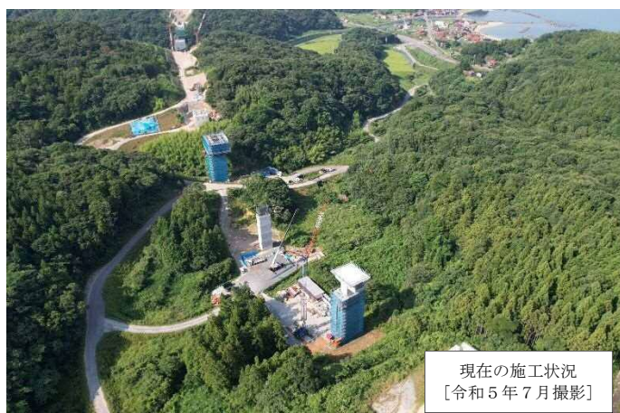
現在の施工状況 [令和5年7月撮影]