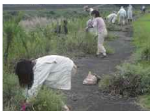
外来植物調査・駆除

水生生物の調査研究や、生態系を維持するために外来生物の駆除活動などを行い、河川環境を維持します。