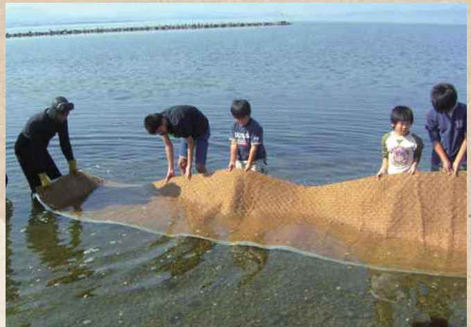
【鳥取県・島根県】中海 NPO法人 未来守りネットワーク

河川協力団体によるアマモ場再生への取り組み。作業に地域の子ども達も参加することで、自分達が住む地域への関心や、自然環境に対する意識の向上につながっている。