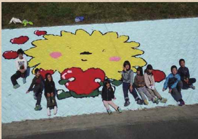
【徳島県】桑野川 横見町をきれいにする会

誰でも、いつでも気軽に近づく快適な河川空間は維持・管理が重要です。河川協力団体が実際の作業を行うにあたって、河川管理者と河川協力団体が協力して計画を作成するなど、両者が一体となって安心・安全な河川空間の維持・管理の質の向上につながっています。