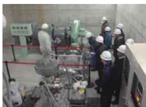
河川・ダム管理状況説明

過去の水害などの伝承や、防災に関わる活動、またダムなど河川にある施設での説明会などを実施します。