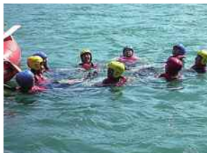
水辺の安全利用講習会

河川や河川空間を使って、観察会や、安全に河川を利用するための講習会などを実施します。