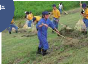
河川の除草・集草