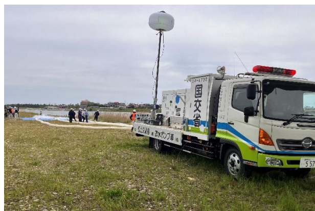
益田市高津地先（鴨嶋大橋直下流付近）