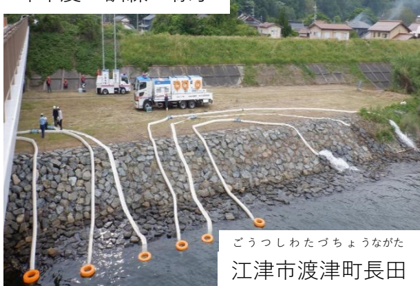
ごうつしわたづちょうながた 江津市渡津町長田