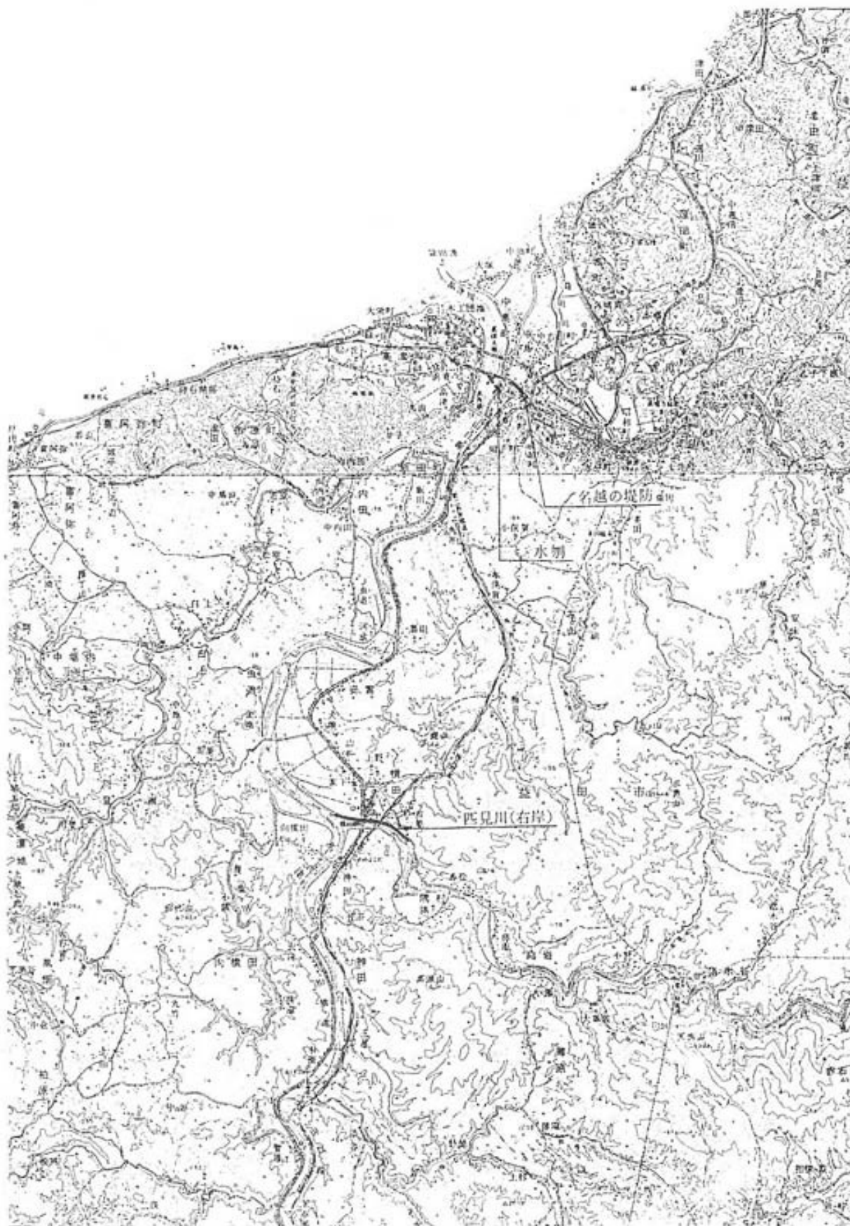
参考図—1 藩制時代の治水施設