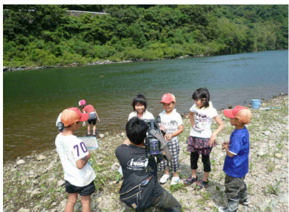
地元ケーブルテレビ、新聞記者からの取材