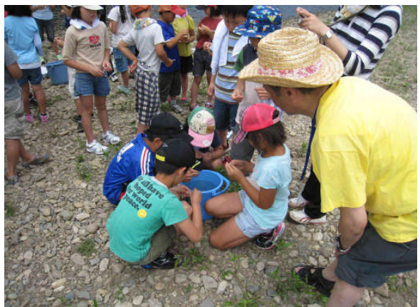
パケットテスト状況 (PH・COD)