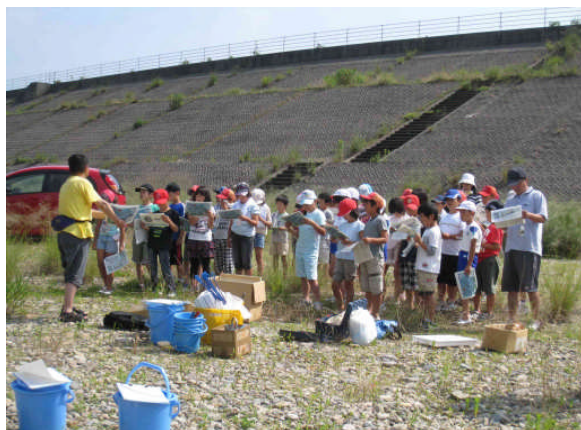
郷田小学校3・4年生41名による水生生物調査